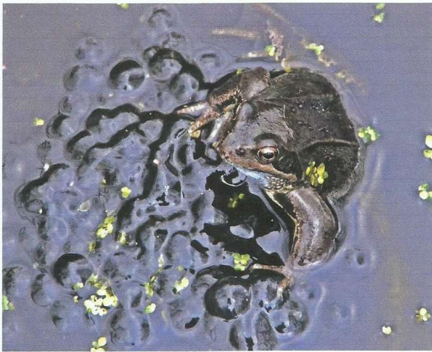
Kikker met dril

Vanaf 11.00 uur staan de kikkers klaar. Meedoen kost niets en kan van af elk tijdstip. Om 16.00 stoppen de kikkers ermee. De heemtuin ligt in het Burg. In 't Veldpark te Zaandam, direct ten zuiden van het Zaans Medisch Centrum. Parkeren kan westelijk van de tuin, aan de parallelweg van de Heijermansstraat, in de Rosmolenwijk of oostelijk van de tuin, nabij de IJdoornflat in de wijk Peldersveld. Meer info: www.zaansnatuurmilieucentrum.nl