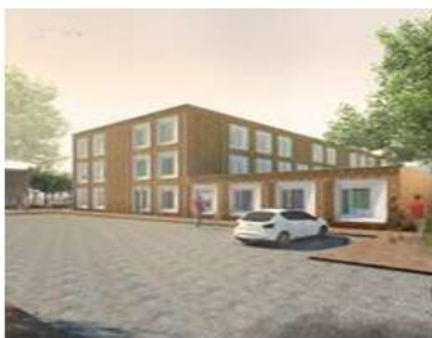
Zijaanzicht aan de S. Claeszstraat

Wat betreft de nieuwbouw hebben we de procedure van de informatieverstrekking aan en het overleg met de buurtbewoners gevolgd aan de hand van informatieavonden en klankbordgroep avonden. De