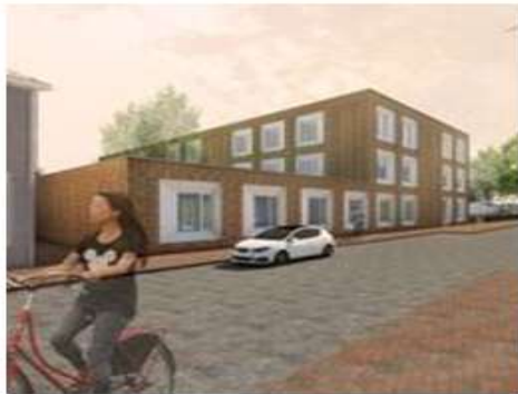
Zijaanzicht CJ Keghstraat

De vergunningsprocedure is vanaf december gestart en duurt ongeveer zes maanden. Gedurende een periode van zes weken kunnen eventuele andere zienswijze en/of bezwaren ingediend worden. Afhankelijk van de inbreng kan de vergunning eind mei worden afgegeven. Zodra de aannemer bekend is, worden de planning en de daaraan verbonden data duidelijk en kan er gestart worden met de sloop en de bouw van de nieuwe school. De planning kunnen we dan ook concreter met u communiceren. Over een tijdelijk onderkomen van de groepen in de huidige locatie Roggeplein zullen we u op de hoogte brengen, zodra daarover volledige duidelijkheid is.