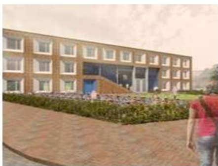
Vooraanzicht aan het Roggeplein.